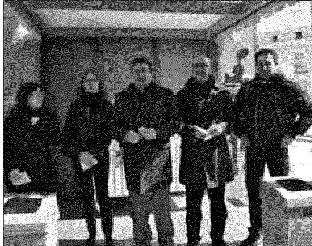
La conferenza stampa; a destra un cassonetto per la differenziata